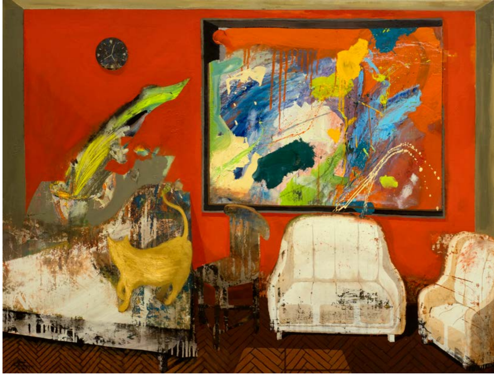
İsimsiz / Untitled, 2021 Tuval üzerine yağlıboya / Oil on canvas 97 x 128 cm