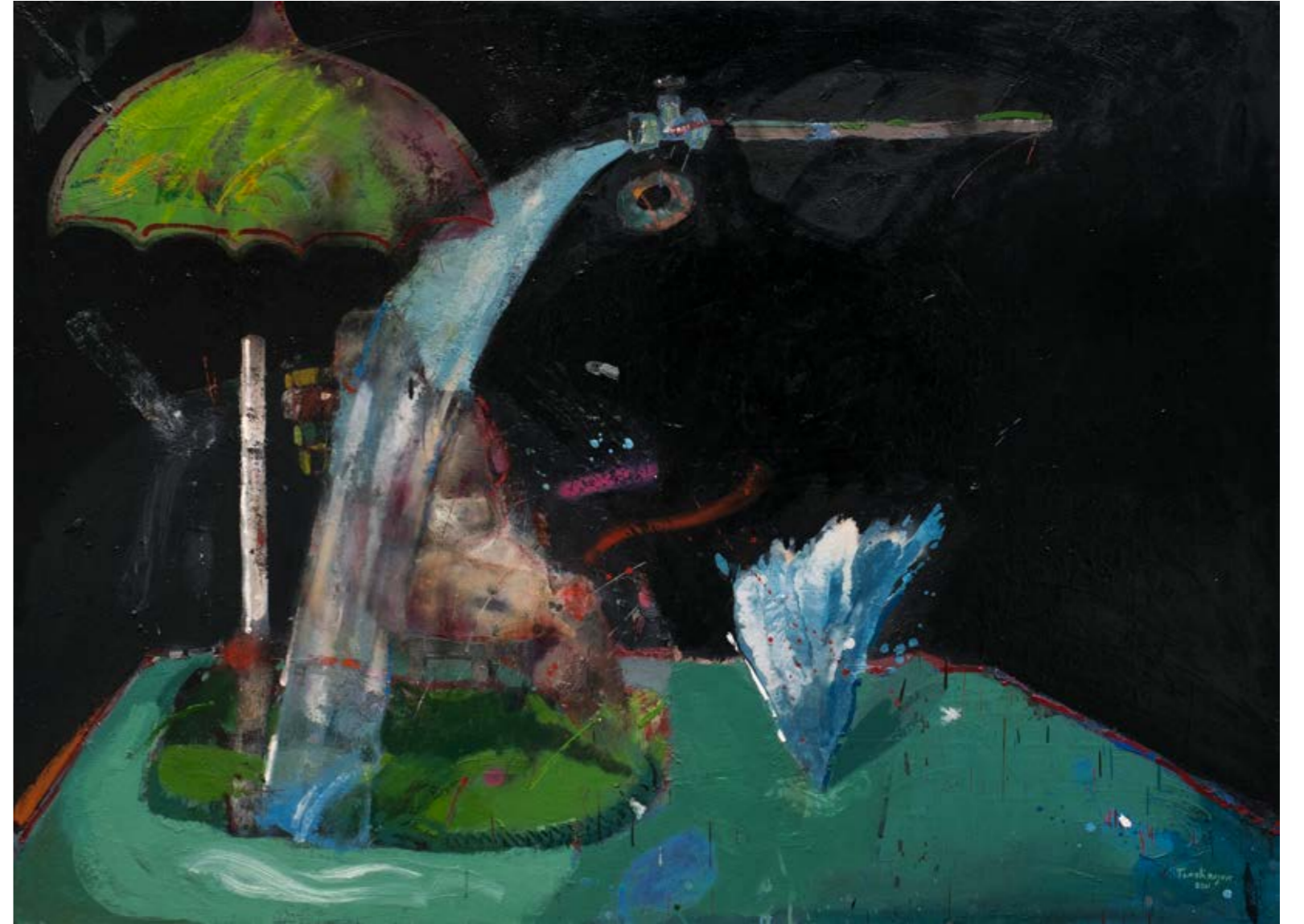
İsimsiz / Untitled, 2021 Tuval üzerine yağlıboya / Oil on canvas 110 x 150 cm