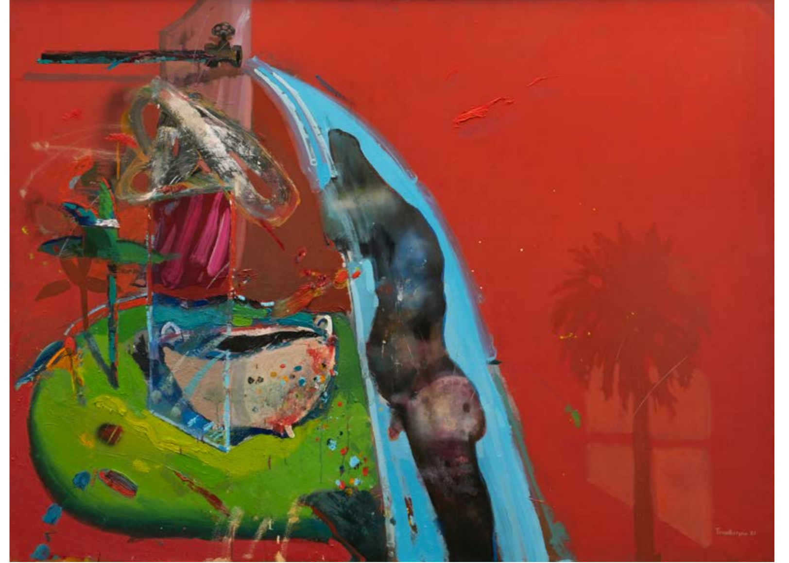
Yaz Vakti / Summer Time, 2021 Tuval üzerine yağlıboya / Oil on canvas 110 x 150 cm