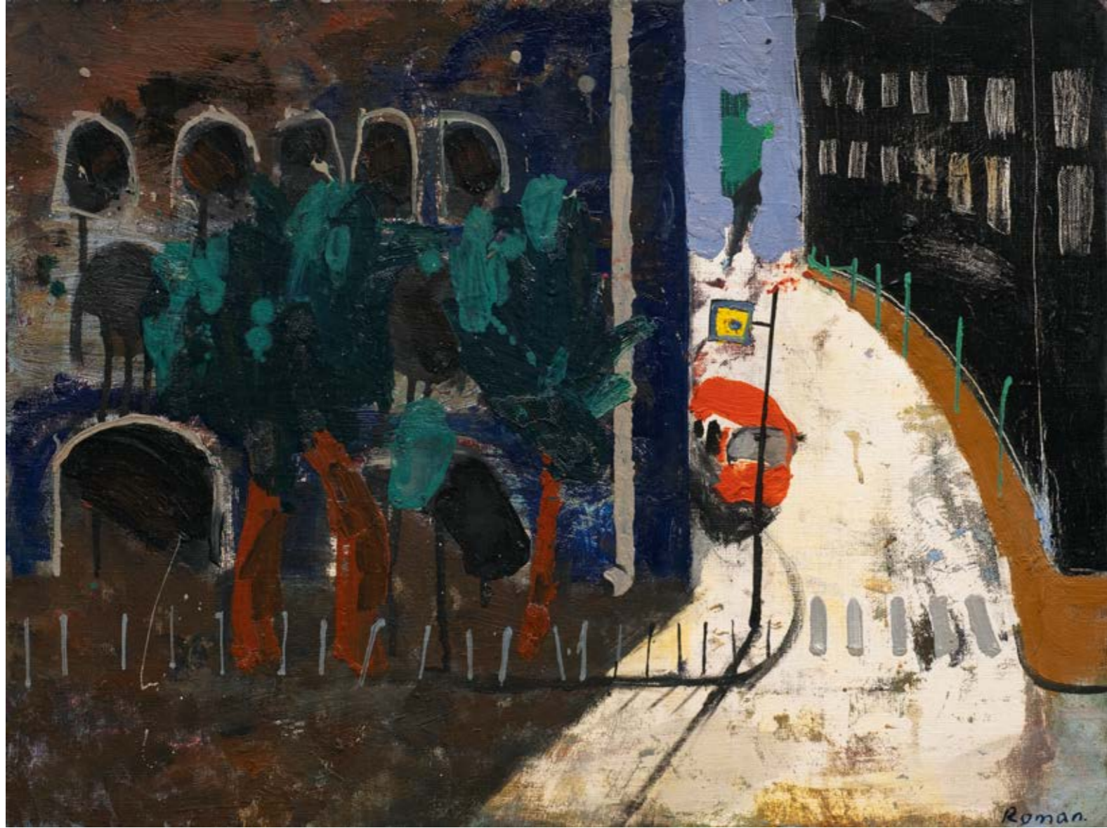
Roman KAKOYAN 6. Hat / 6th Line, 2021 Tuval üzerine yağlıboya / Oil on canvas 52 x 70 cm