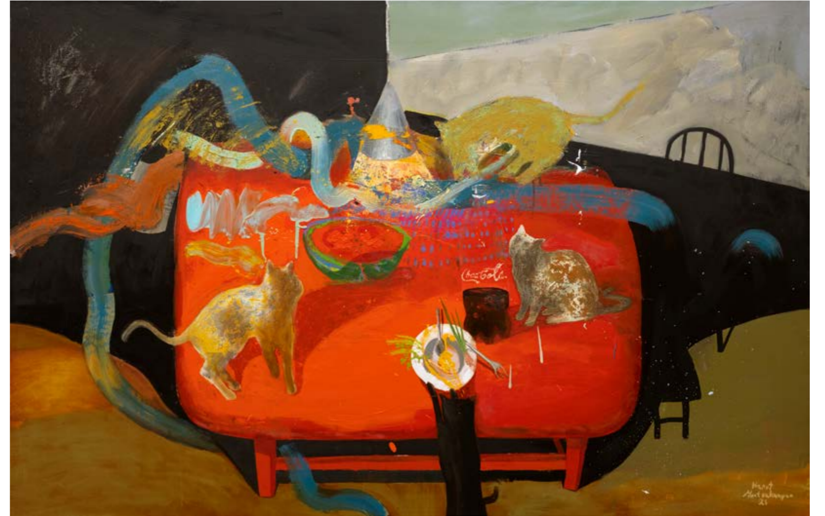
Harut MNATSAKANYAN Parti / Party, 2021 Tuval üzerine yağlıboya / Oil on canvas 95 x 148 cm