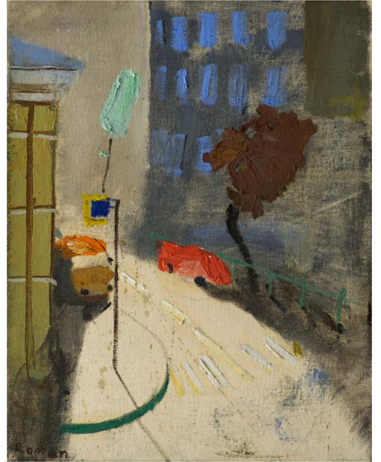
Roman KAKOYAN İsimsiz / Untitled, 2021 Tuval üzerine yağlıboya / Oil on canvas 49 x 39 cm