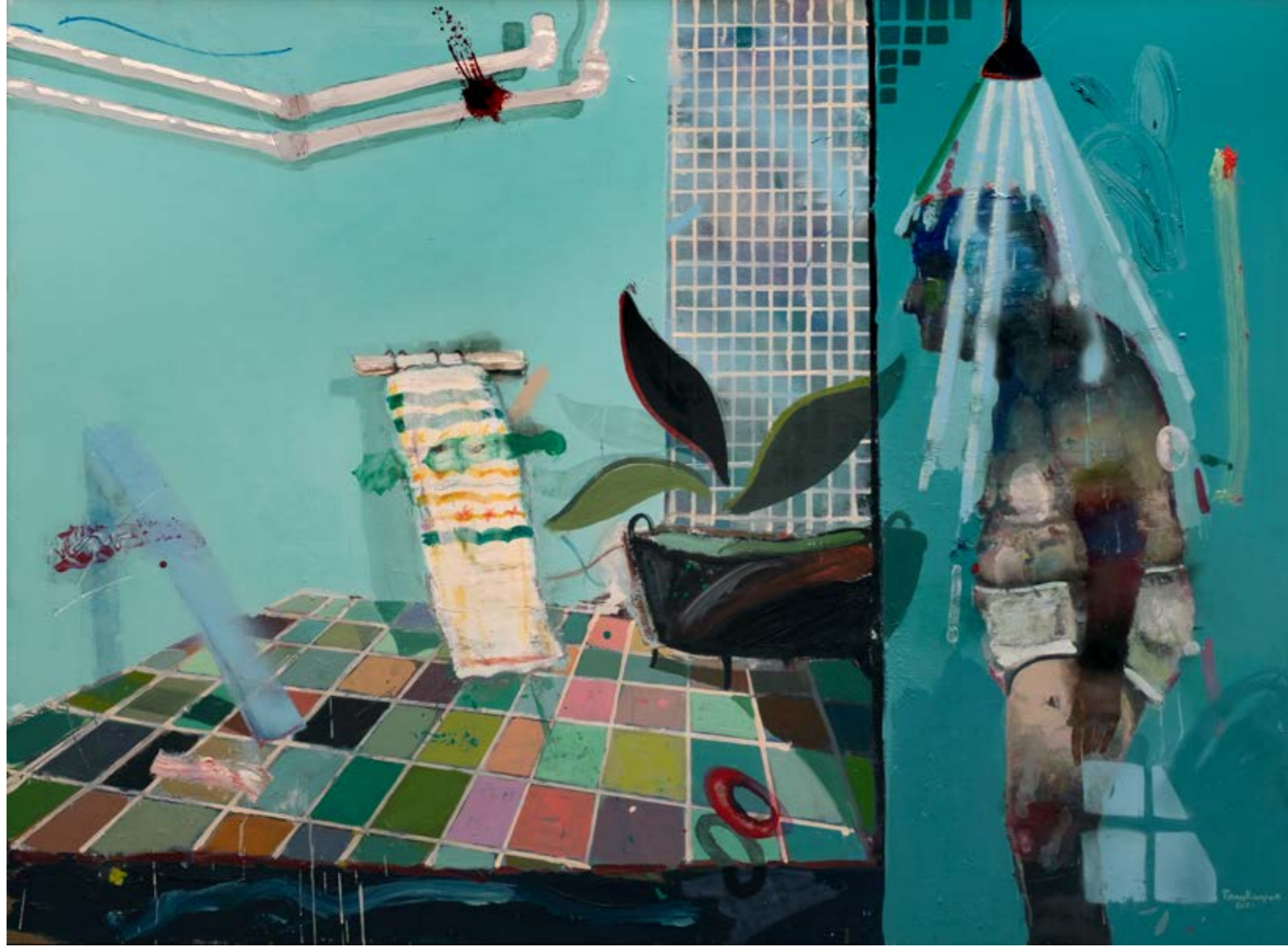
Banyo / Bathroom, 2021 Tuval üzerine yağlıboya / Oil on canvas 110 x 150 cm