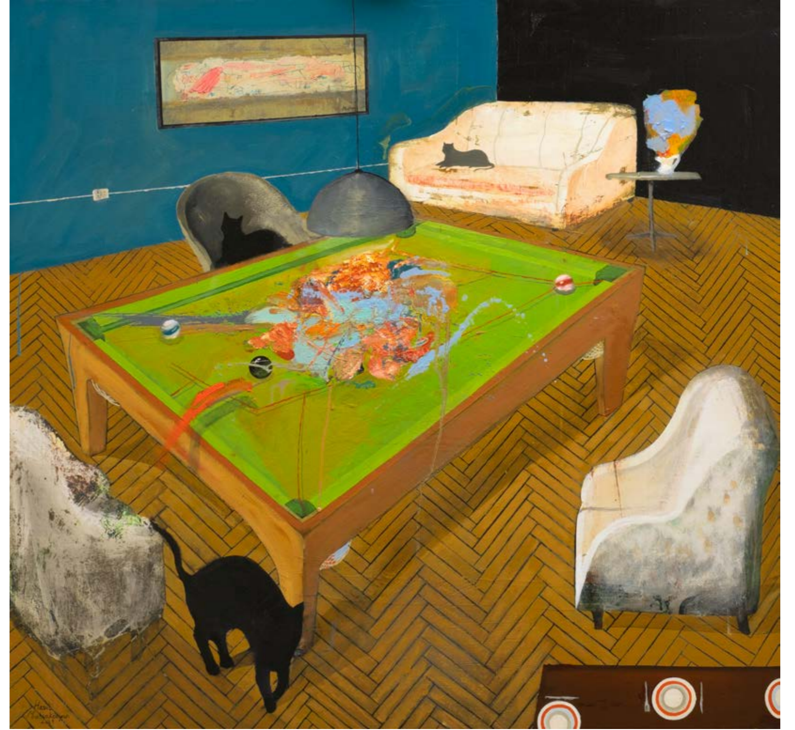
İsimsiz / Untitled, 2021 Tuval üzerine yağlıboya / Oil on canvas 95 x 100 cm