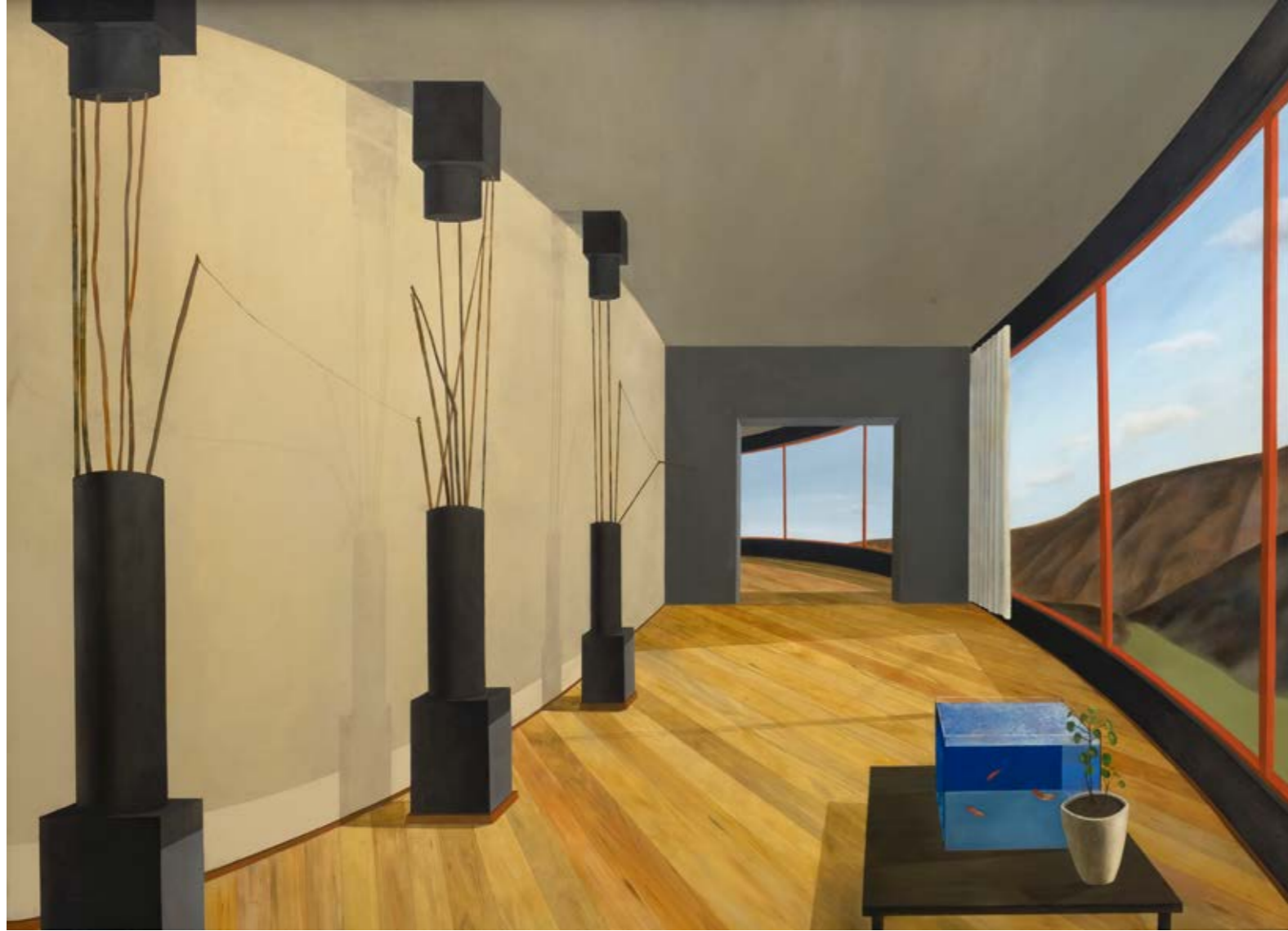
Roman KAKOYAN Dairesel Daire / Circular Apartment, 2022 Tuval üzerine yağlıboya / Oil on canvas 120 x 162 cm