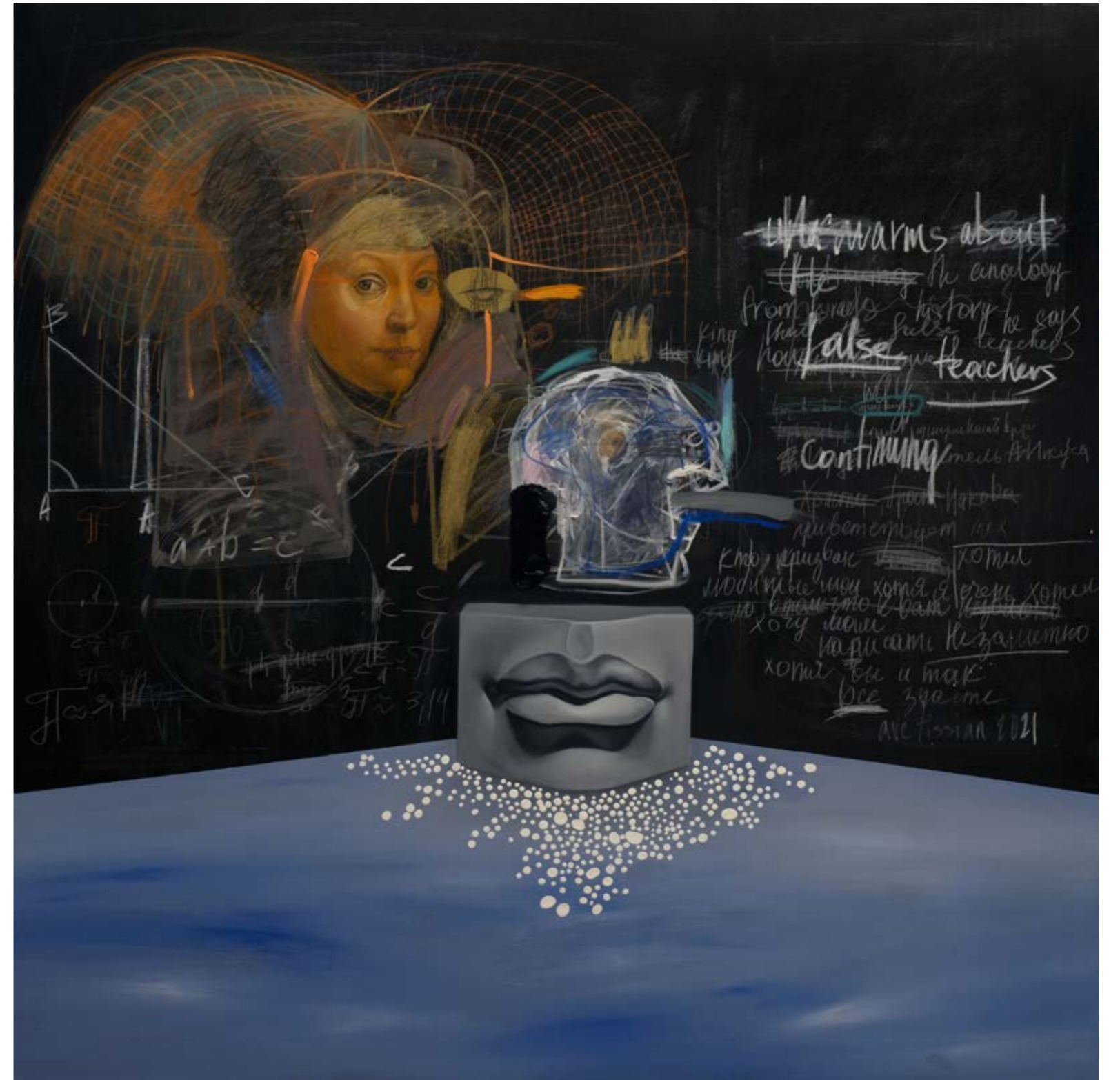
Gayane AVETISSIAN Kara Tahta N2 / Blackboard N2, 2021 Tuval üzerine yağlıboya ve karışık teknik / Oil and mixed media on canvas 140 x 140 cm