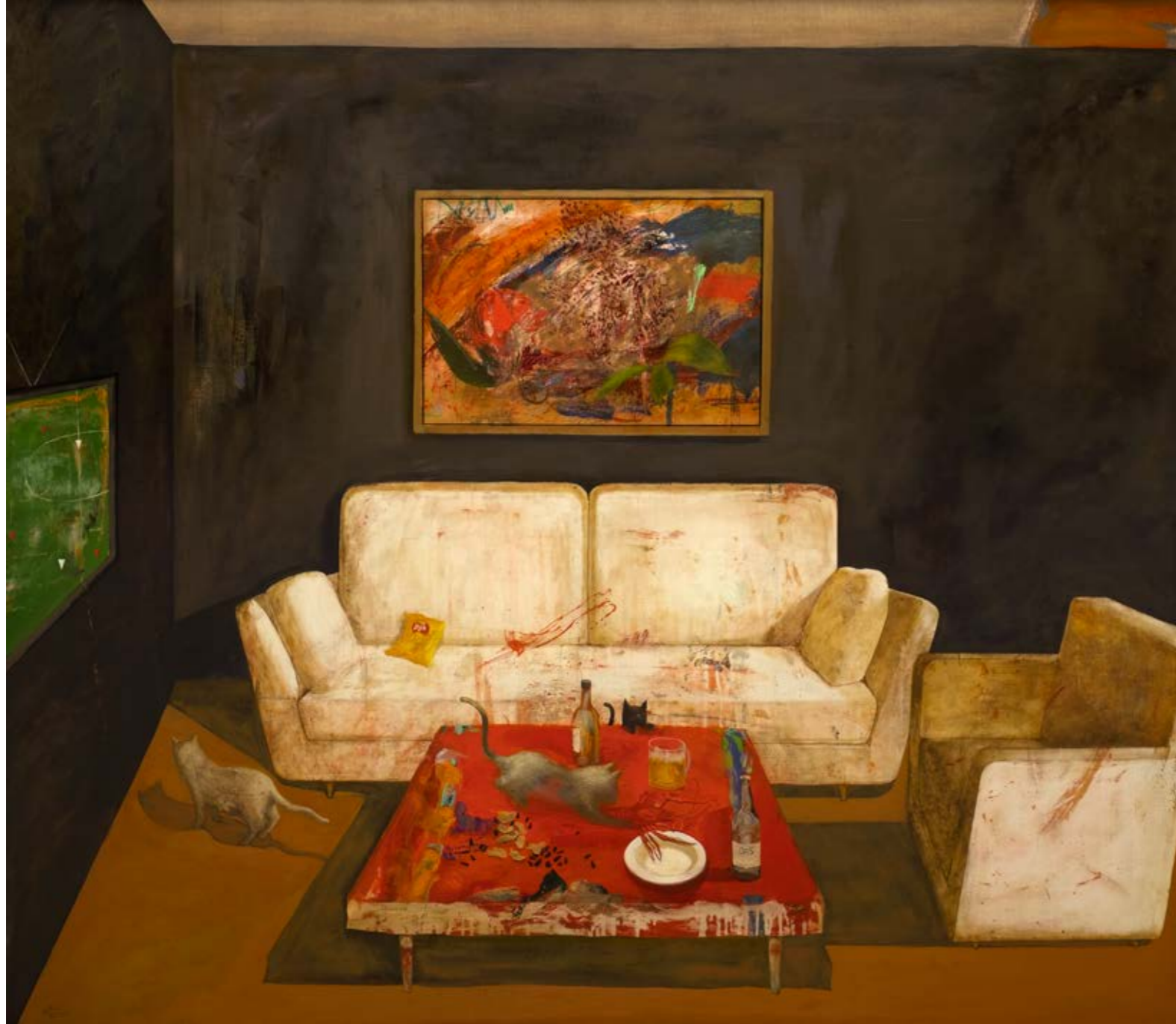
Harut MNATSAKANYAN İsimsiz / Untitled, 2022 Tuval üzerine yağlıboya / Oil on canvas 145 x 164 cm