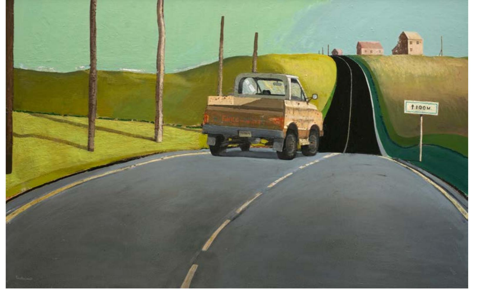
Arthur TONAKANYAN Kenar Mahalle / Suburb, 2022 Tuval üzerine yağlıboya / Oil on canvas 100 x 160 cm