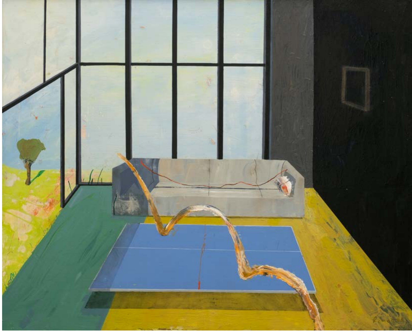
Masa Tenisi Şampiyonası / Ping Pong Championship, 2021 Tuval üzerine yağlıboya / Oil on canvas, 100 x 120 cm