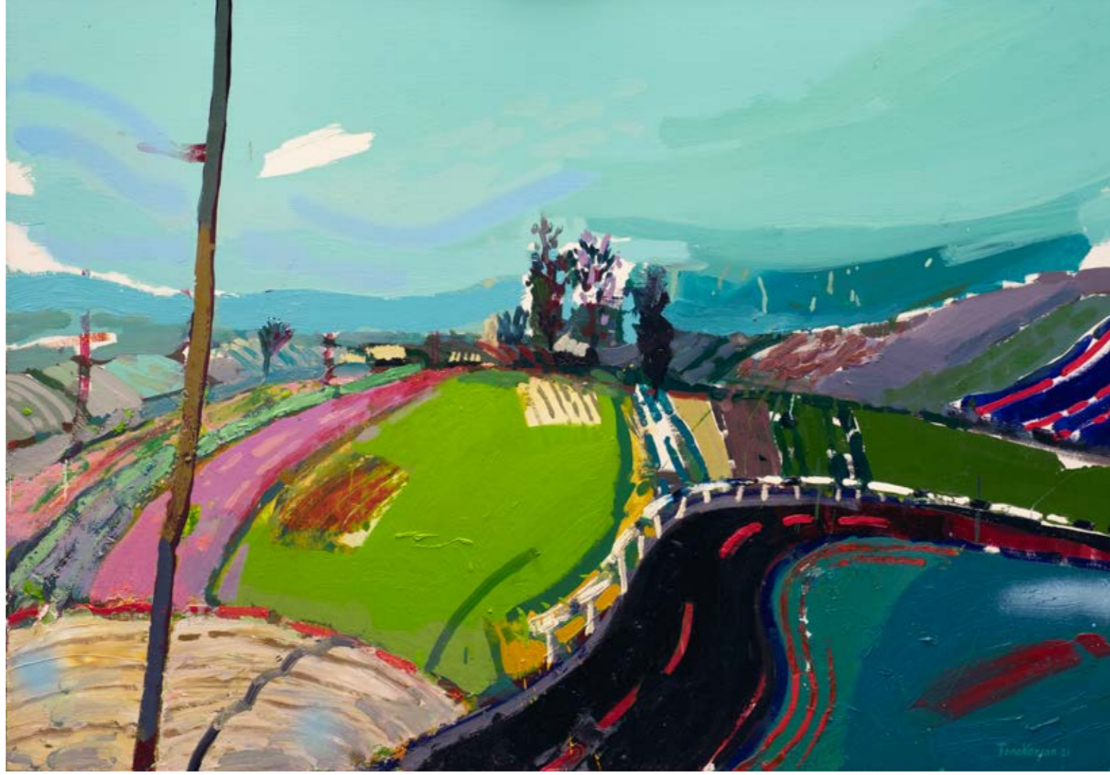
İsimsiz / Untitled, 2021 Tuval üzerine yağlıboya / Oil on canvas 70 x 100 cm