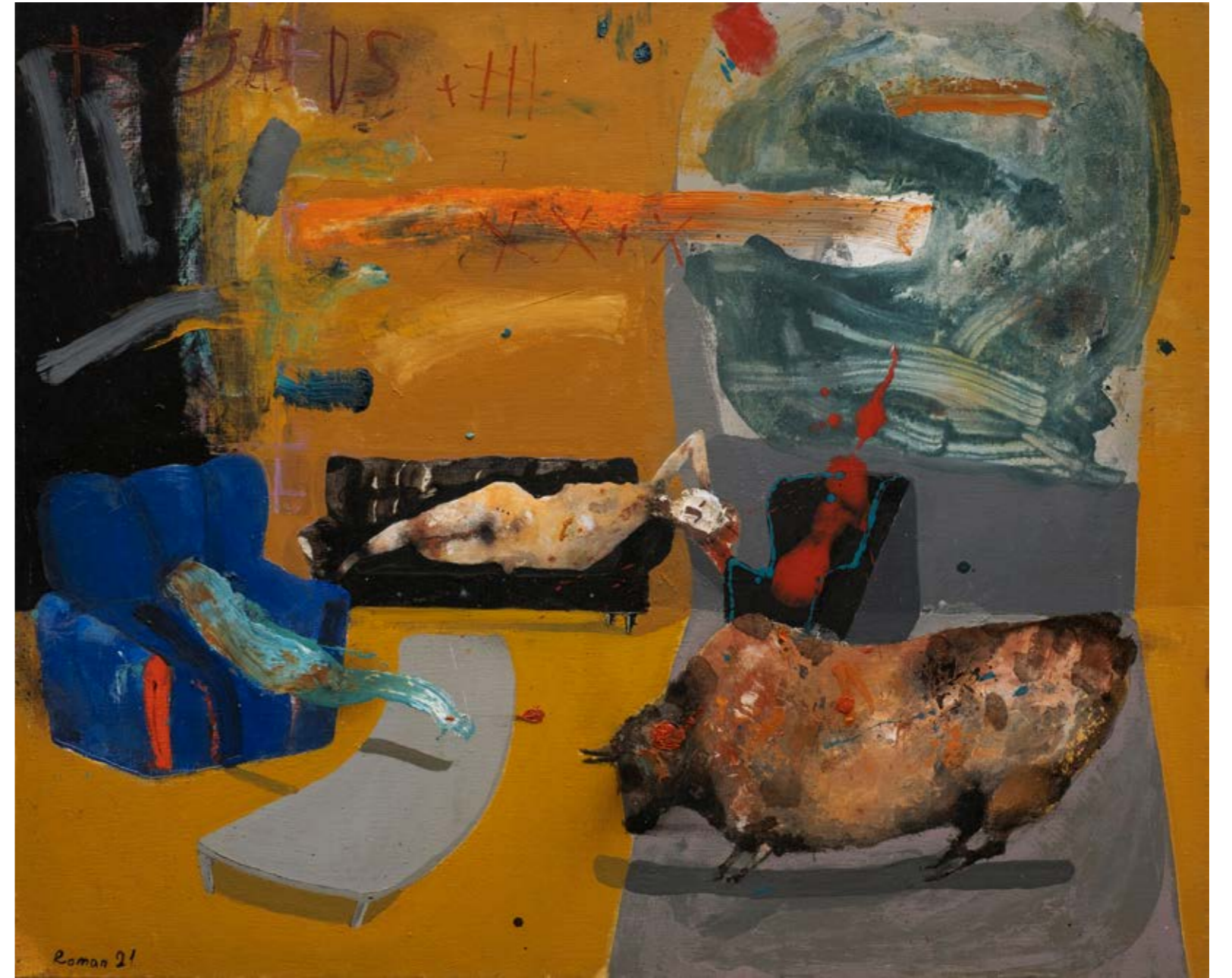
Üç Boyutlu / Three-dimensional, 2021 Tuval üzerine yağlıboya / Oil on canvas, 90 x 110 cm