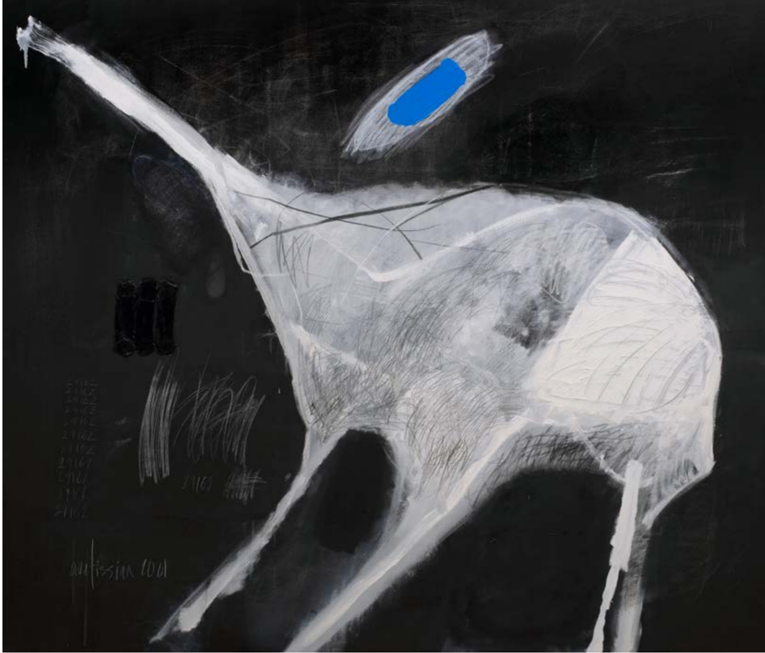
Siyah Fil / The Black Elephant, 2021 Tuval üzerine yağlıboya ve karışık teknik / Oil and mixed media on canvas 125 x 145 cm