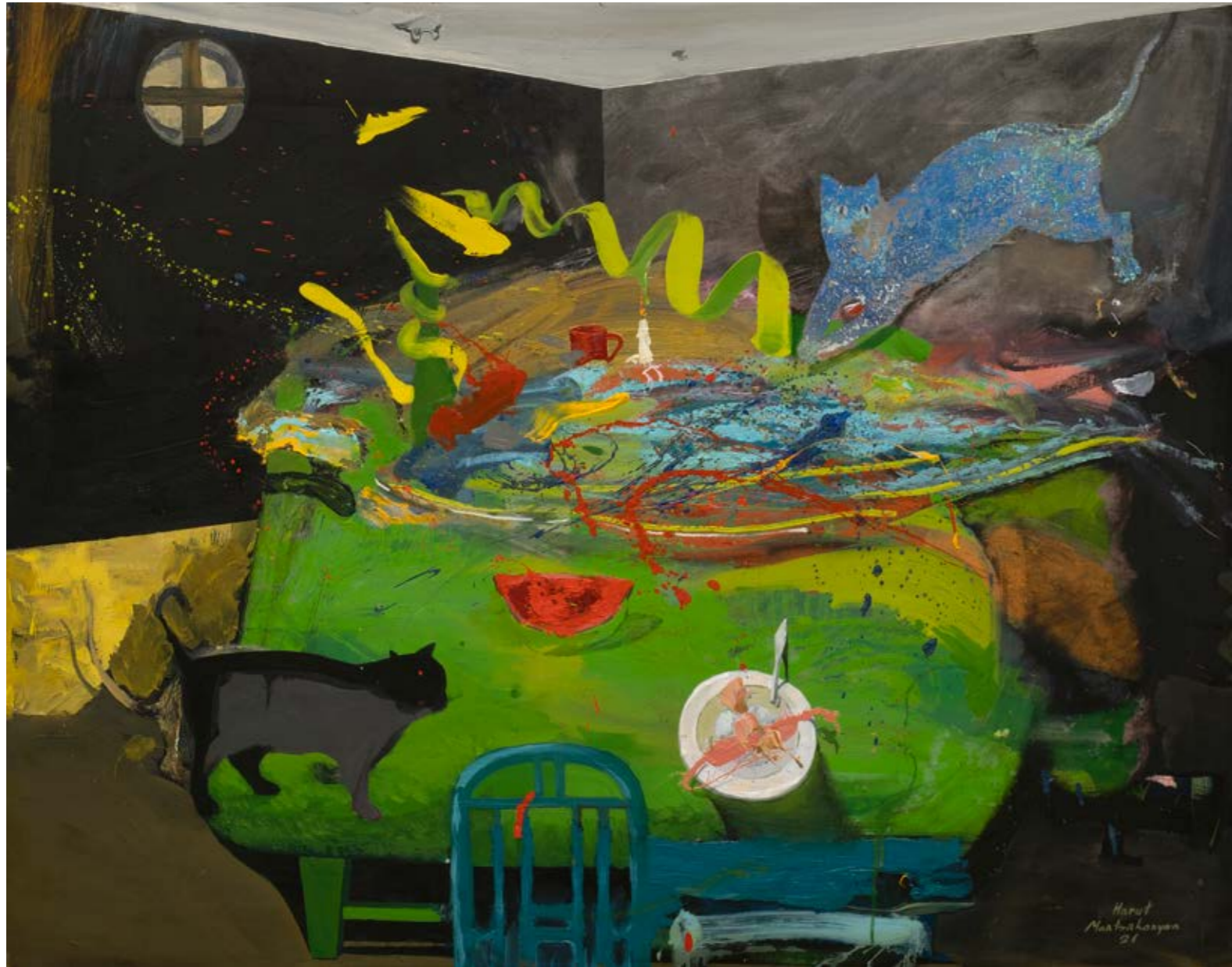
Harut MNATSAKANYAN İsimsiz / Untitled, 2021 Tuval üzerine yağlıboya / Oil on canvas 96 x 123 cm