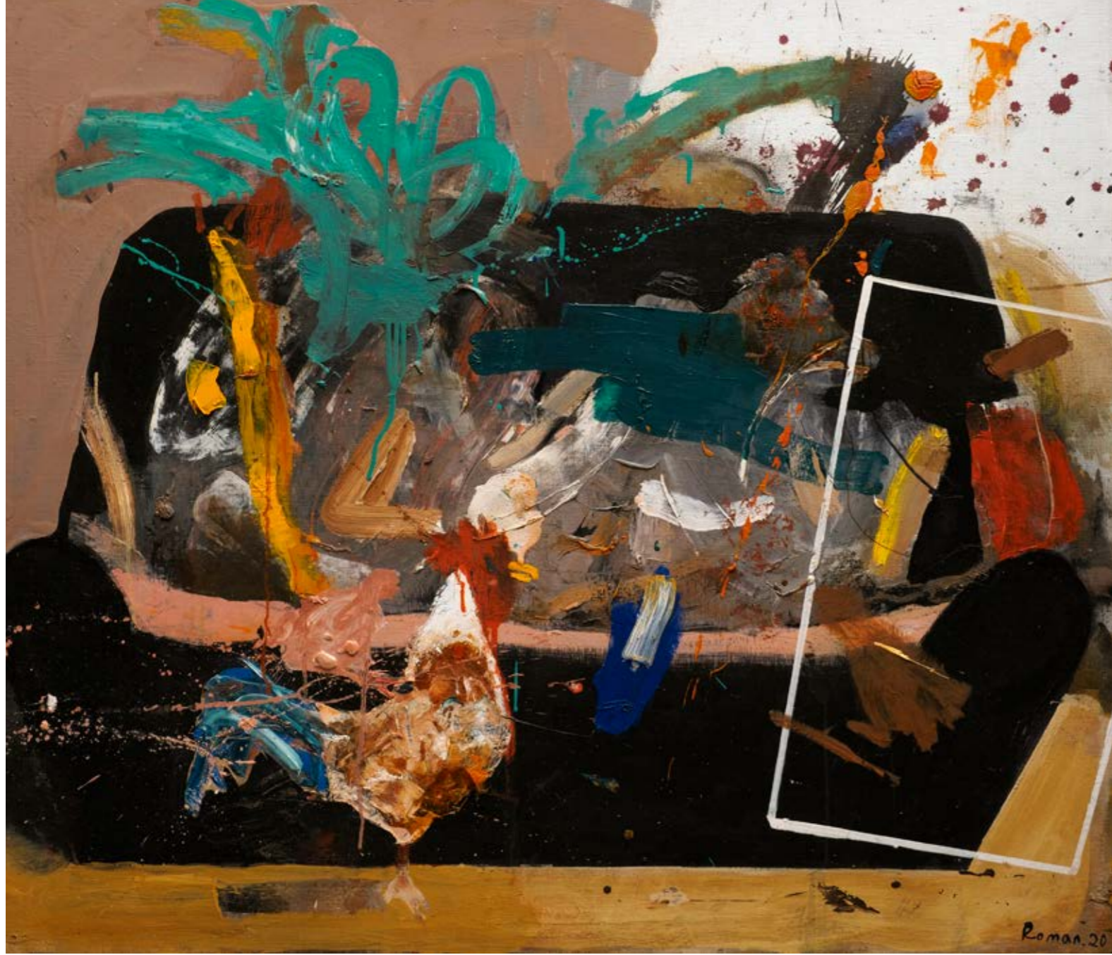
Karışıklık İçindeki Siyah Kanepeler / Black Sofa in A Mess, 2020 Tuval üzerine yağlıboya / Oil on canvas 93 x 108 cm