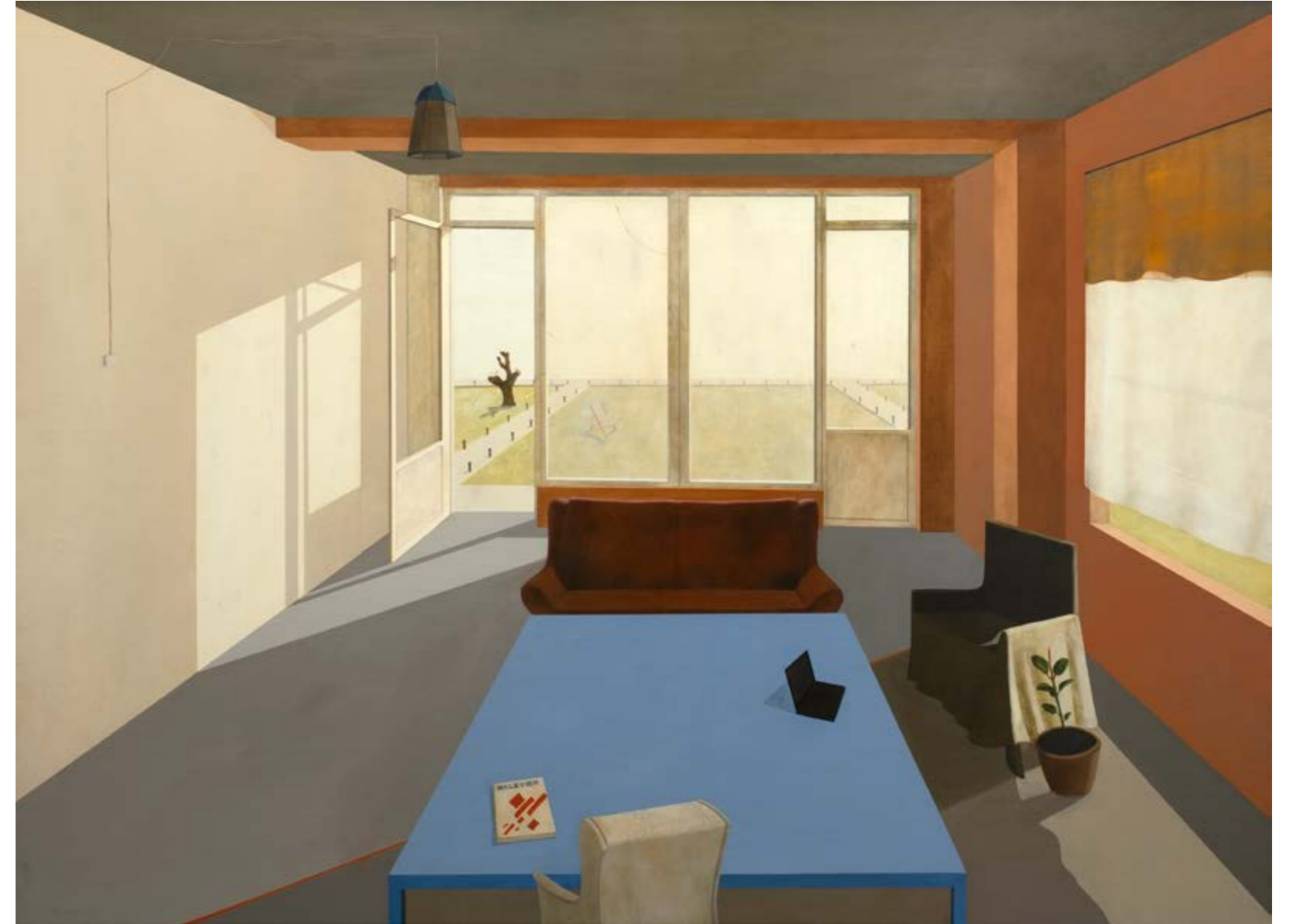
Roman KAKOYAN Daire-3 / Apartment-3, 2022 Tuval üzerine yağlıboya / Oil on canvas 138 x 188 cm