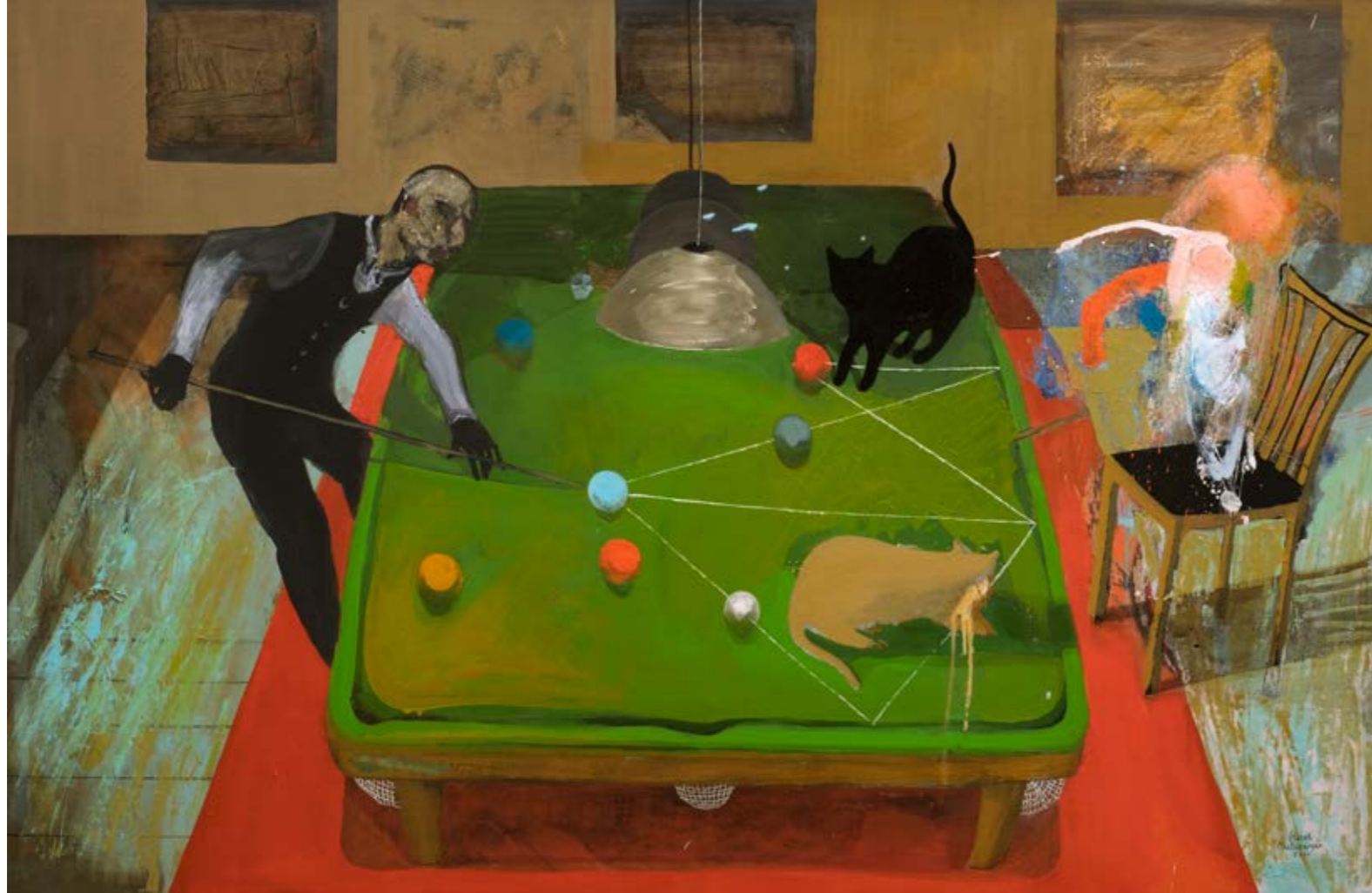
İsimsiz / Untitled, 2021 Tuval üzerine yağlıboya / Oil on canvas 97 x 149 cm