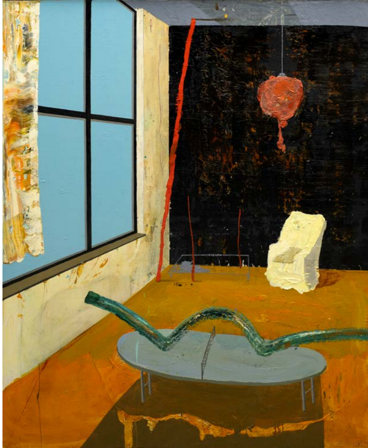
Masa Tenisi / Ping Pong, 2021 Tuval üzerine yağlıboya / Oil on canvas 120 x 100 cm