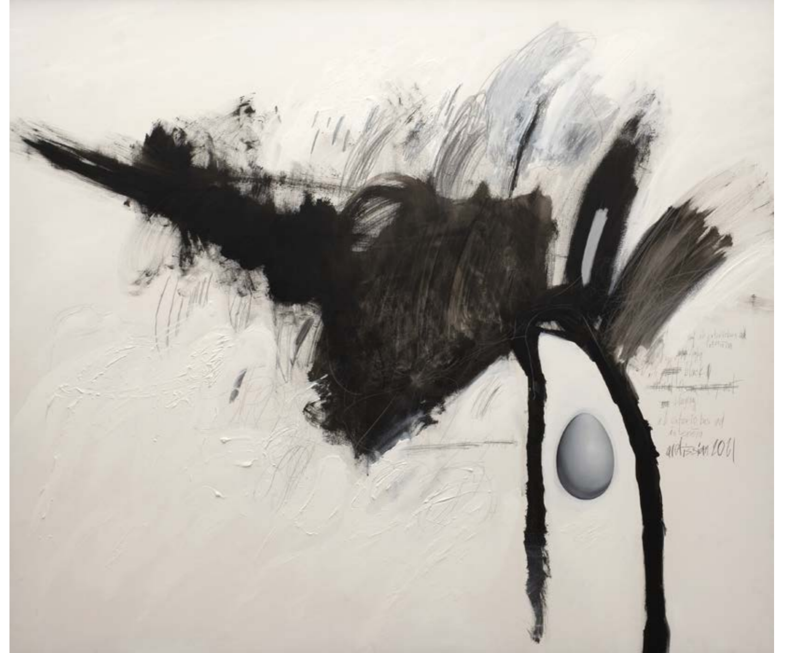
Siyah Kuş / The Black Bird, 2021 Tuval üzerine yağlıboya ve karışık teknik / Oil and mixed media on canvas 125 x 145 cm