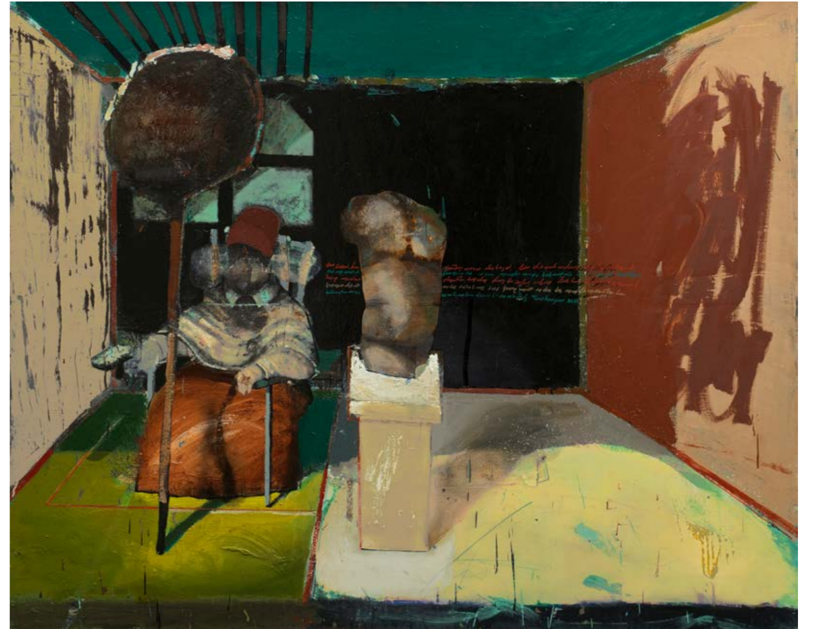
Arthur TONAKANYAN İsimsiz / Untitled, 2021 Tuval üzerine yağlıboya / Oil on canvas 120 x 150 cm