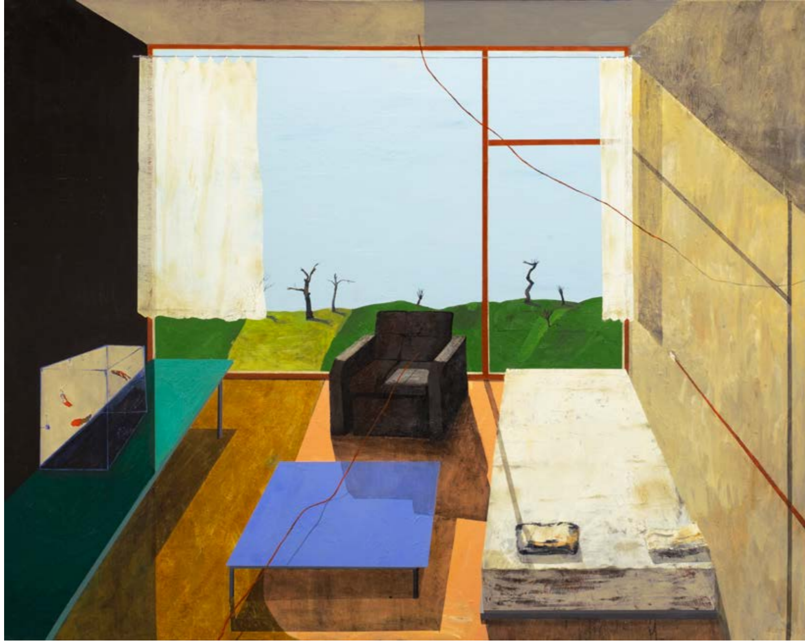
Daire Numarası 2 / Apartment Number 2, 2021 Tuval üzerine yağlıboya / Oil on canvas 140 x 175 cm