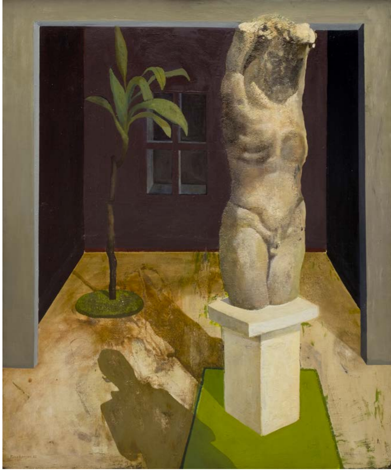
Arthur TONAKANYAN İsimsiz / Untitled, 2022 Tuval üzerine yağlıboya / Oil on canvas 115 x 95 cm