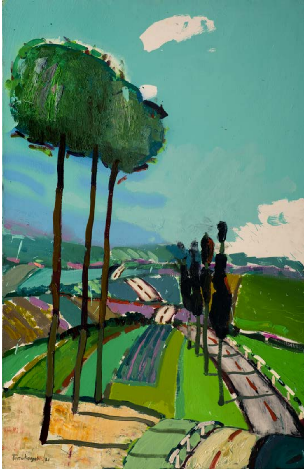
İsimsiz / Untitled, 2021 Tuval üzerine yağlıboya / Oil on canvas 100 x 65 cm