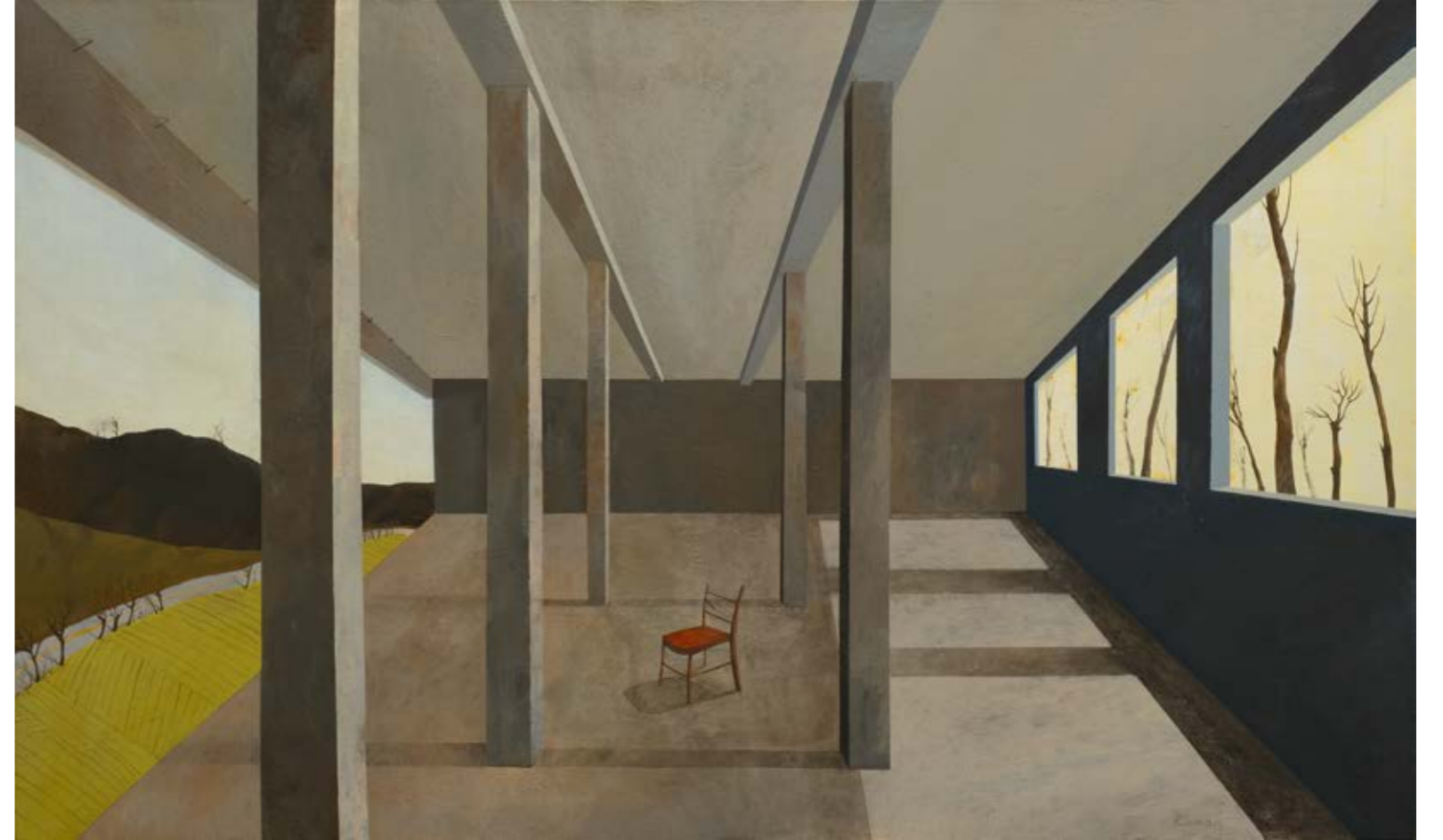
Yıkılan Binanın Muhafızları / The Guards of the Demolished Building, 2021 Tuval üzerine yağlıboya / Oil on canvas, 90 x 150 cm