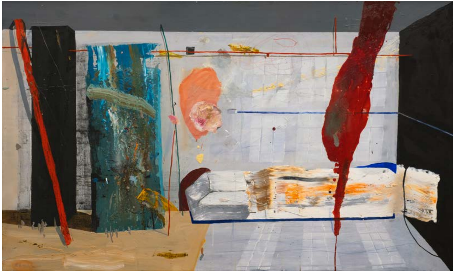
Daire Numarası 1 / Apartment Number 1, 2021 Tuval üzerine yağlıboya / Oil on canvas 90 x 150 cm