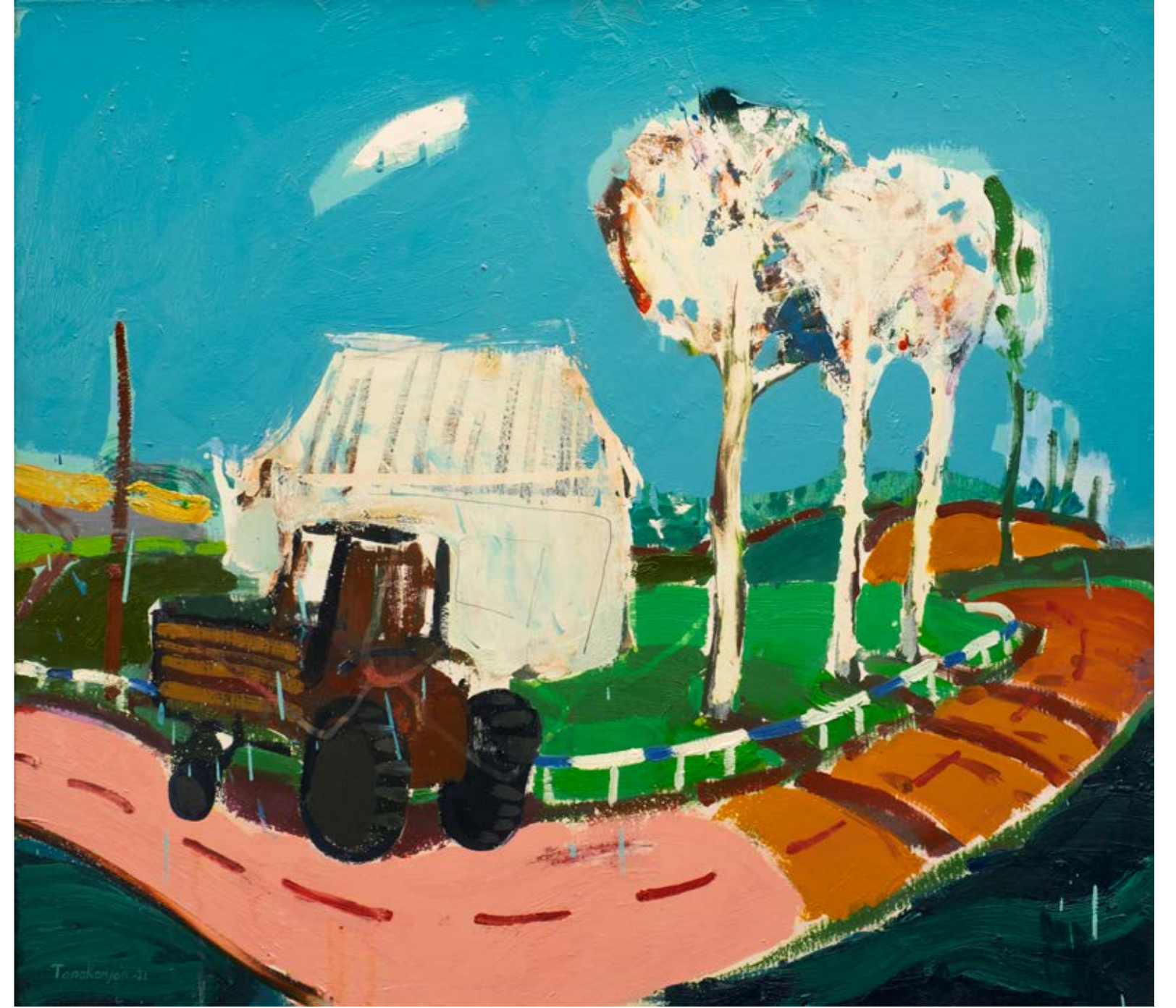
İsimsiz / Untitled, 2021 Tuval üzerine yağlıboya / Oil on canvas 70 x 80 cm