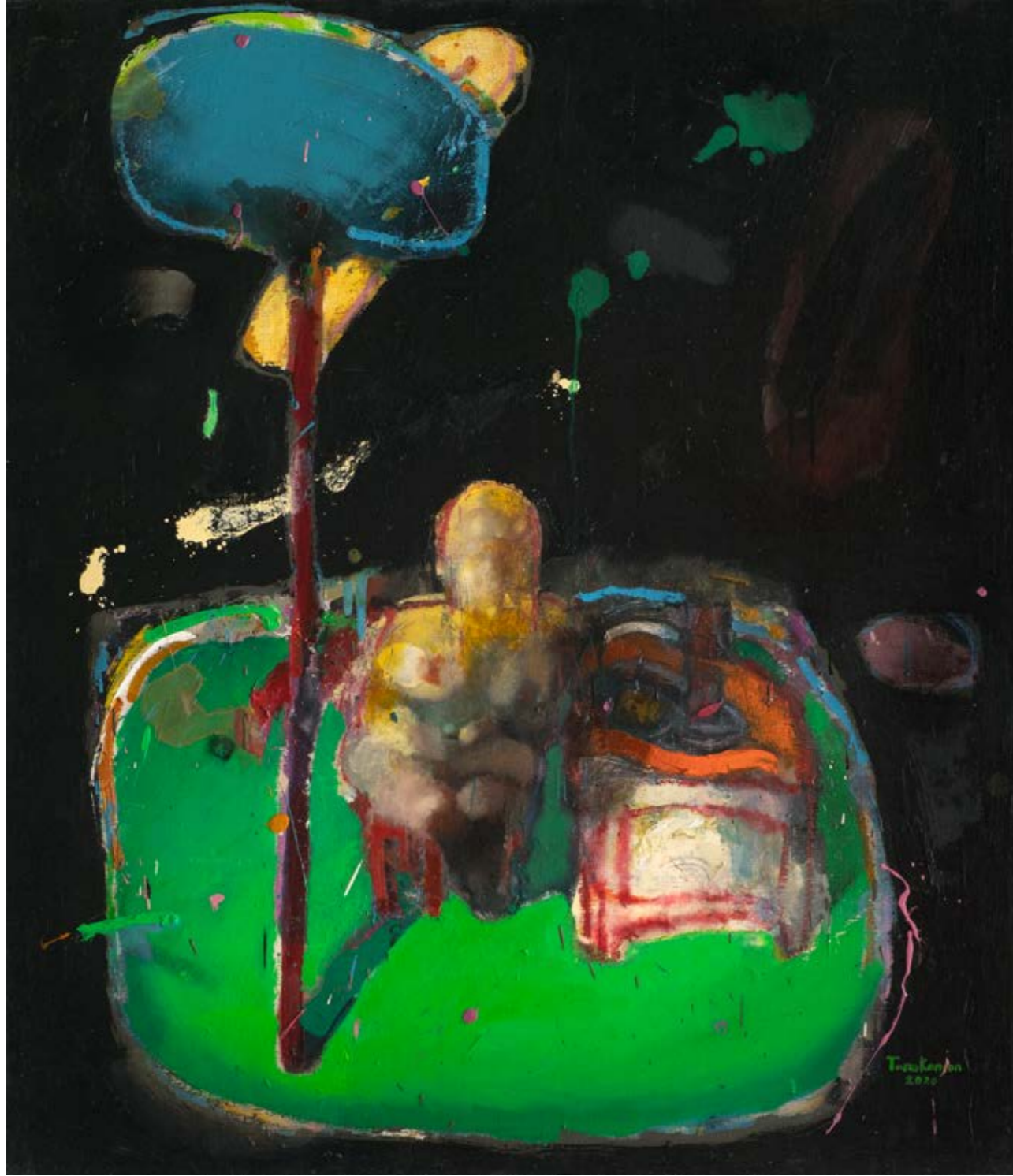
Arthur TONAKANYAN İsimsiz / Untitled, 2020 Tuval üzerine yağlıboya / Oil on canvas 106 x 93 cm