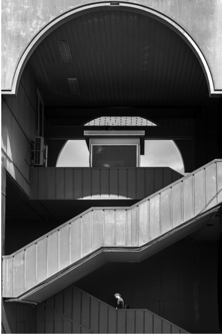
Galata Köprüsü, İstanbul / Galata Bridge, Istanbul, 2019 Hahnemühle (Photo Rag) asitsiz sanatsal kâğıt üzerine arşivsel pigment baskı Archival pigment print on Hahnemühle (Photo Rag) acid free fine art paper 105 x 75 cm [Ed.3+1 AP]