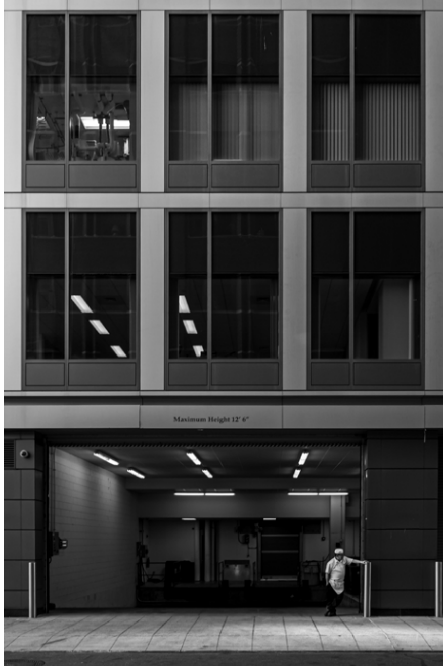
Mola, Boston / Break Time, Boston, 2023 Hahnemühle (Photo Rag) asitsiz sanatsal kâğıt üzerine arşivsel pigment baskı Archival pigment print on Hahnemühle (Photo Rag) acid free fine art paper 105 x 75 cm [Ed.3+1 AP]