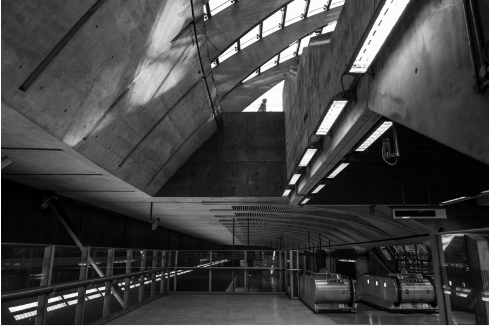
Canary Wharf 1, Londra / Canary Wharf 1, London, 2022 Hahnemühle (Photo Rag) asitsiz sanatsal kâğıt üzerine arşivsel pigment baskı Archival pigment print on Hahnemühle (Photo Rag) acid free fine art paper 75 x 105 cm [Ed.3+1 AP]