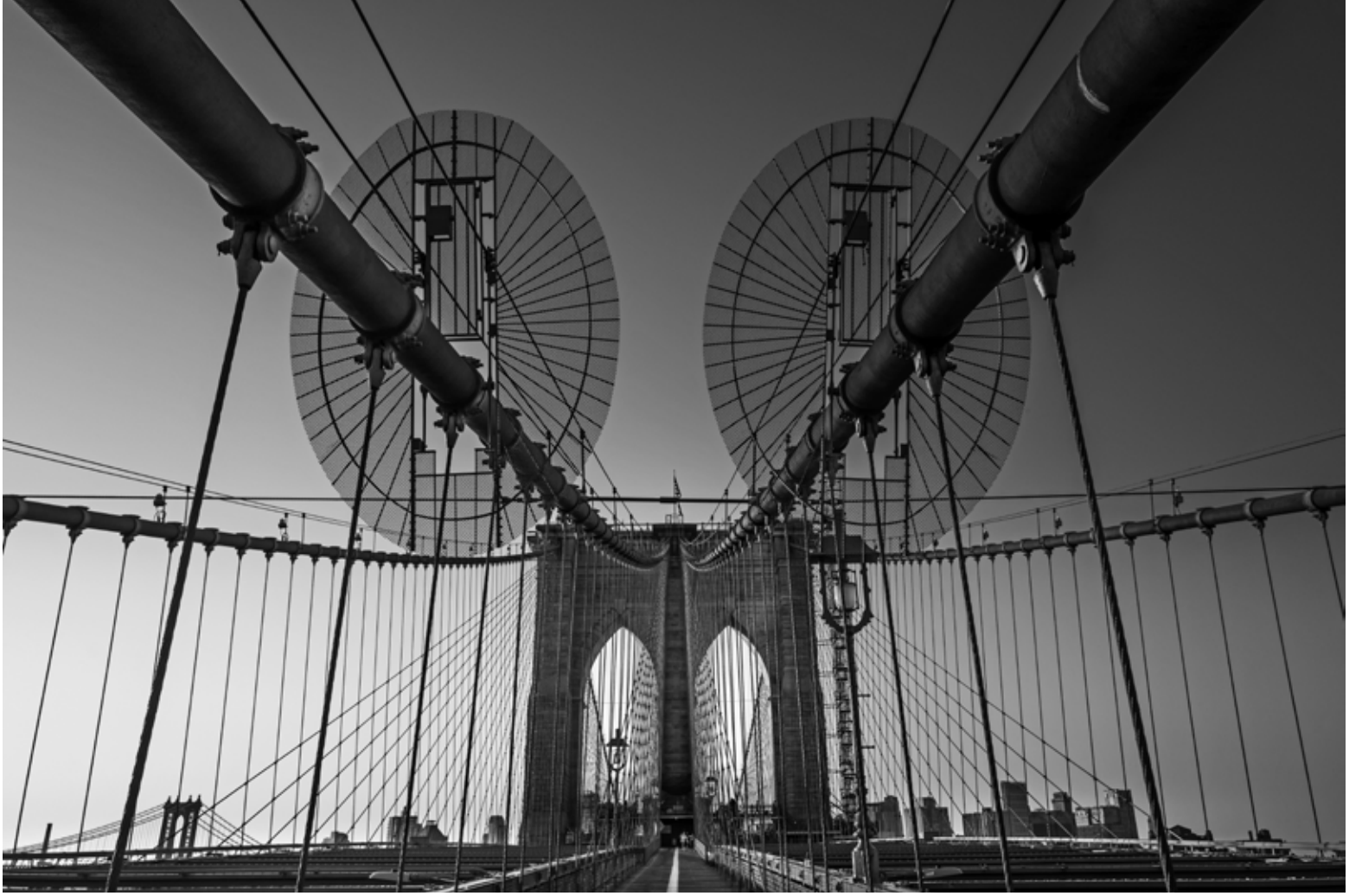
Brooklyn Köprüsü 2, New York / Brooklyn Bridge 2, New York, 2021 Hahnemühle (Photo Rag) asitsiz sanatsal kâğıt üzerine arşivsel pigment baskı Archival pigment print on Hahnemühle (Photo Rag) acid free fine art paper 36,5 x 50 cm [Ed.3+1 AP]