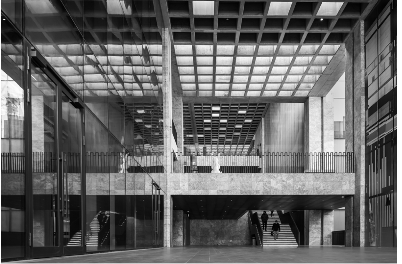
Atatürk Kültür Merkezi, İstanbul / Atatürk Cultural Center, Istanbul, 2021 Hahnemühle (Photo Rag) asitsiz sanatsal kâğıt üzerine arşivsel pigment baskı Archival pigment print on Hahnemühle (Photo Rag) acid free fine art paper 75 x 105 cm [Ed.3+1 AP]