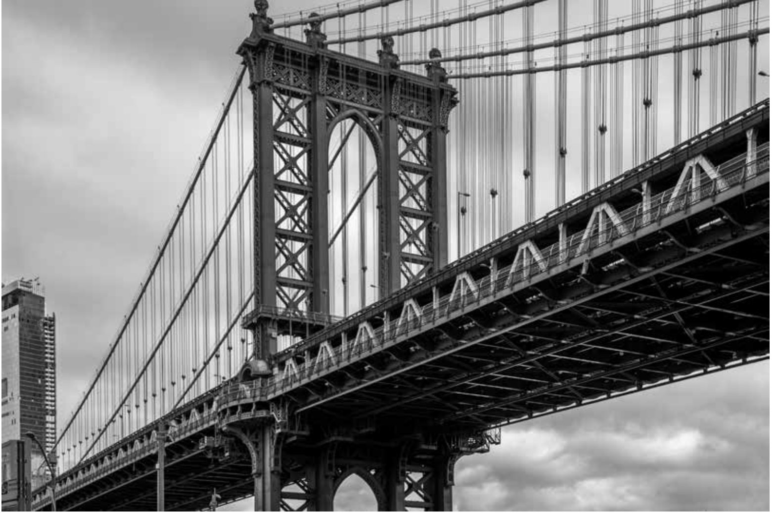
Brooklyn Köprüsü 1, New York / Brooklyn Bridge 1, New York, 2018 Hahnemühle (Photo Rag) asitsiz sanatsal kâğıt üzerine arşivsel pigment baskı Archival pigment print on Hahnemühle (Photo Rag) acid free fine art paper 36,5 x 50 cm [Ed.3+1 AP]