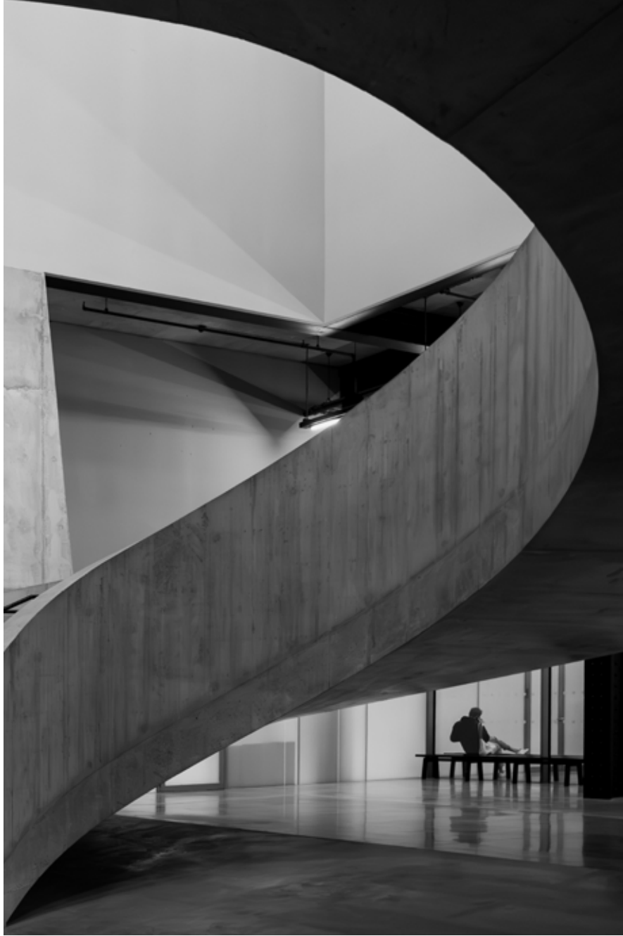
Tate Modern 2, Londra / Tate Modern 2, London, 2022 Hahnemühle (Photo Rag) asitsiz sanatsal kâğıt üzerine arşivsel pigment baskı Archival pigment print on Hahnemühle (Photo Rag) acid free fine art paper 105 x 75 cm [Ed.3+1 AP]