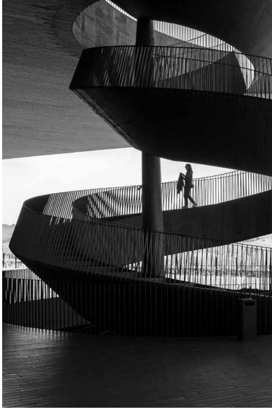
Antinori nel Chianti Classico 3, Toskana / Antinori nel Chianti Classico 3, Tuscany, 2023 Hahnemühle (Photo Rag) asitsiz sanatsal kâğıt üzerine arşivsel pigment baskı Archival pigment print on Hahnemühle (Photo Rag) acid free fine art paper 105 x 75 cm [Ed.3+1 AP]