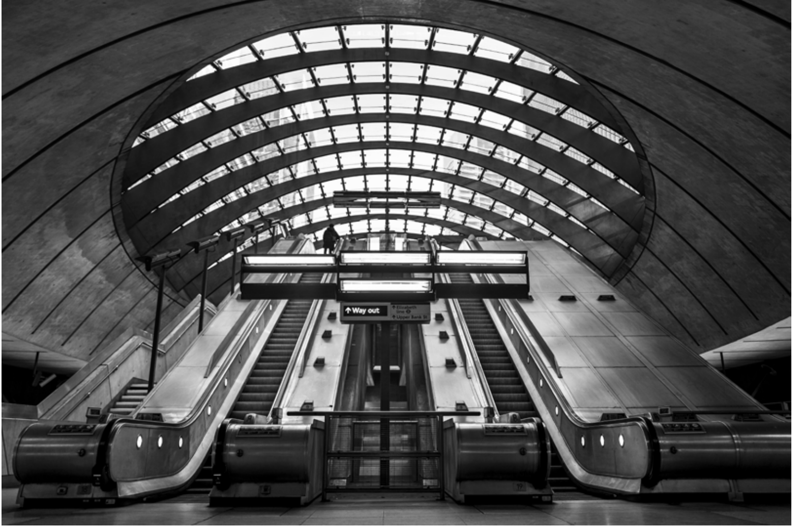
Canary Wharf 2, Londra / Canary Wharf 2, London, 2023 Hahnemühle (Photo Rag) asitsiz sanatsal kâğıt üzerine arşivsel pigment baskı Archival pigment print on Hahnemühle (Photo Rag) acid free fine art paper 75 x 105 cm [Ed.3+1 AP]