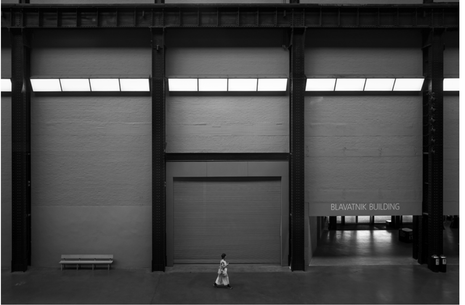
Tate Modern 4, Londra / Tate Modern 4, London, 2023 Hahnemühle (Photo Rag) asitsiz sanatsal kâğıt üzerine arşivsel pigment baskı Archival pigment print on Hahnemühle (Photo Rag) acid free fine art paper 75 x 105 cm [Ed.3+1 AP]