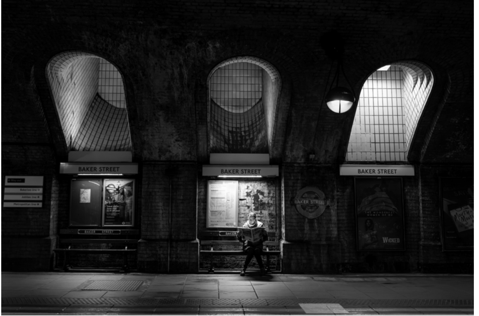
Baker Street İstasyonu, Londra / Baker Street Station, London, 2022 Hahnemühle (Photo Rag) asitsiz sanatsal kâğıt üzerine arşivsel pigment baskı Archival pigment print on Hahnemühle (Photo Rag) acid free fine art paper 75 x 105 cm [Ed.3+1 AP]