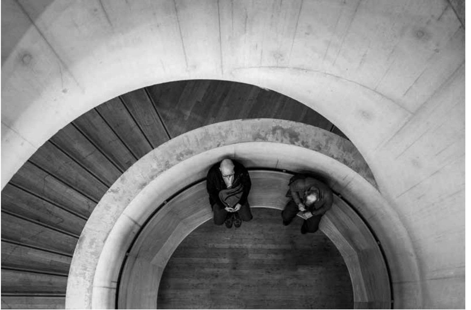
Tate Modern 3, Londra / Tate Modern 3, London, 2023 Hahnemühle (Photo Rag) asitsiz sanatsal kâğıt üzerine arşivsel pigment baskı Archival pigment print on Hahnemühle (Photo Rag) acid free fine art paper 75 x 105 cm [Ed.3+1 AP]