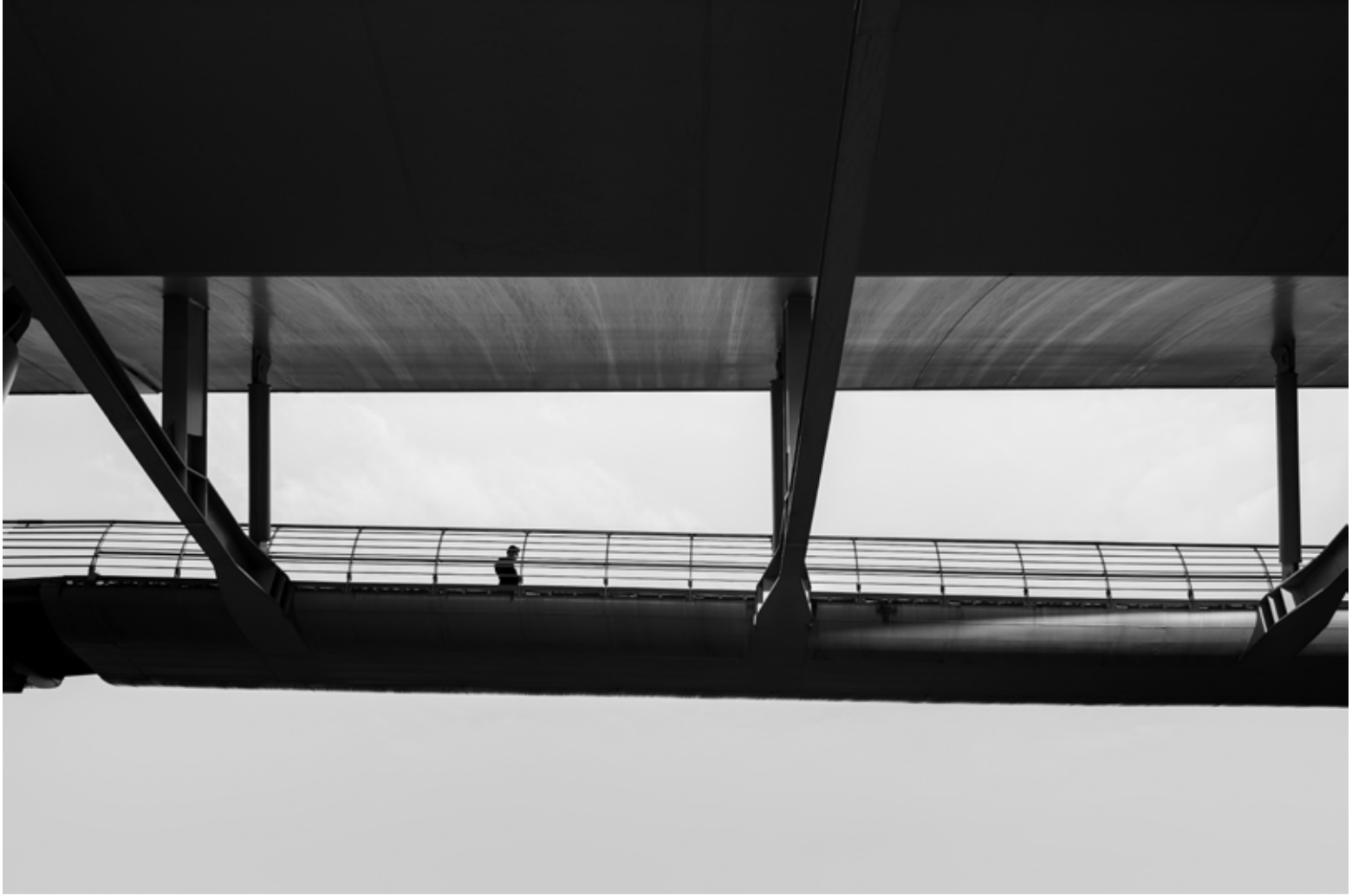
Metro Köprüsü 1, İstanbul / Metro Bridge 1, İstanbul, 2020 Hahnemühle (Photo Rag) asitsiz sanatsal kâğıt üzerine arşivsel pigment baskı Archival pigment print on Hahnemühle (Photo Rag) acid free fine art paper 36,5 x 50 cm [Ed.3+1 AP]