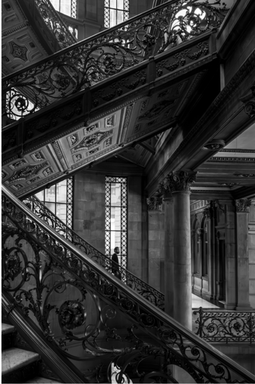
Museo Nacional De Arte, Meksiko / Museo Nacional De Arte, Mexico City, 2023 Hahnemühle (Photo Rag) asitsiz sanatsal kâğıt üzerine arşivsel pigment baskı Archival pigment print on Hahnemühle (Photo Rag) acid free fine art paper 105 x 75 cm [Ed.3+1 AP]