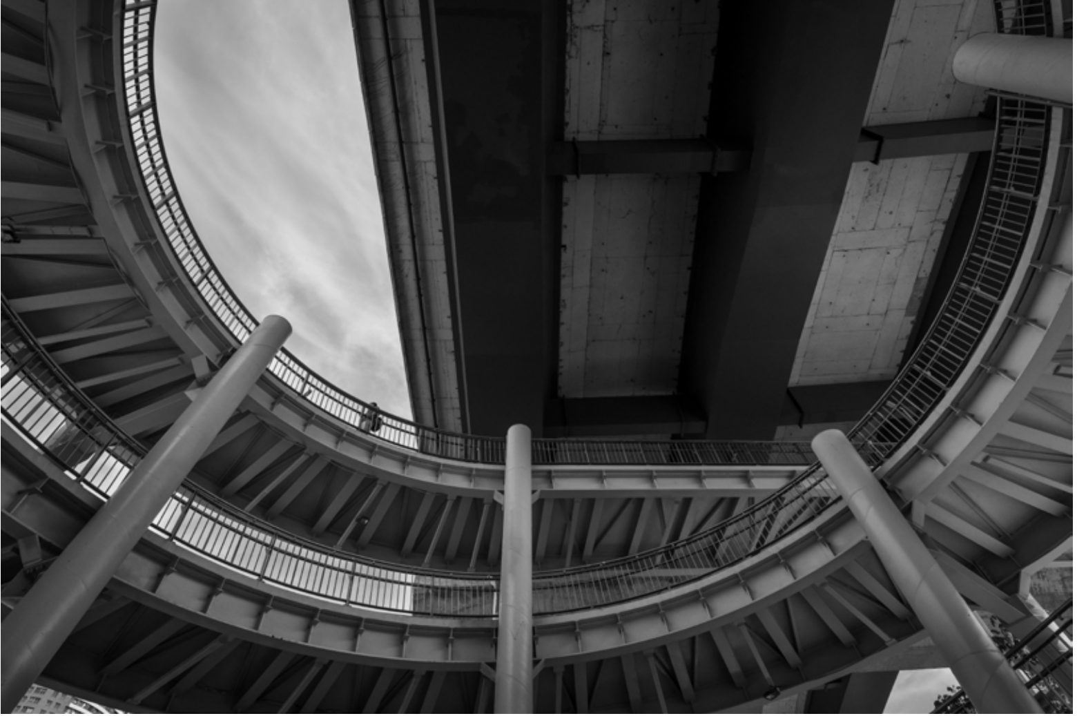
Ünalın, İstanbul / Unalan, İstanbul, 2023 Hahnemühle (Photo Rag) asitsiz sanatsal kâğıt üzerine arşivsel pigment baskı Archival pigment print on Hahnemühle (Photo Rag) acid free fine art paper 75 x 105 cm [Ed.3+1 AP]