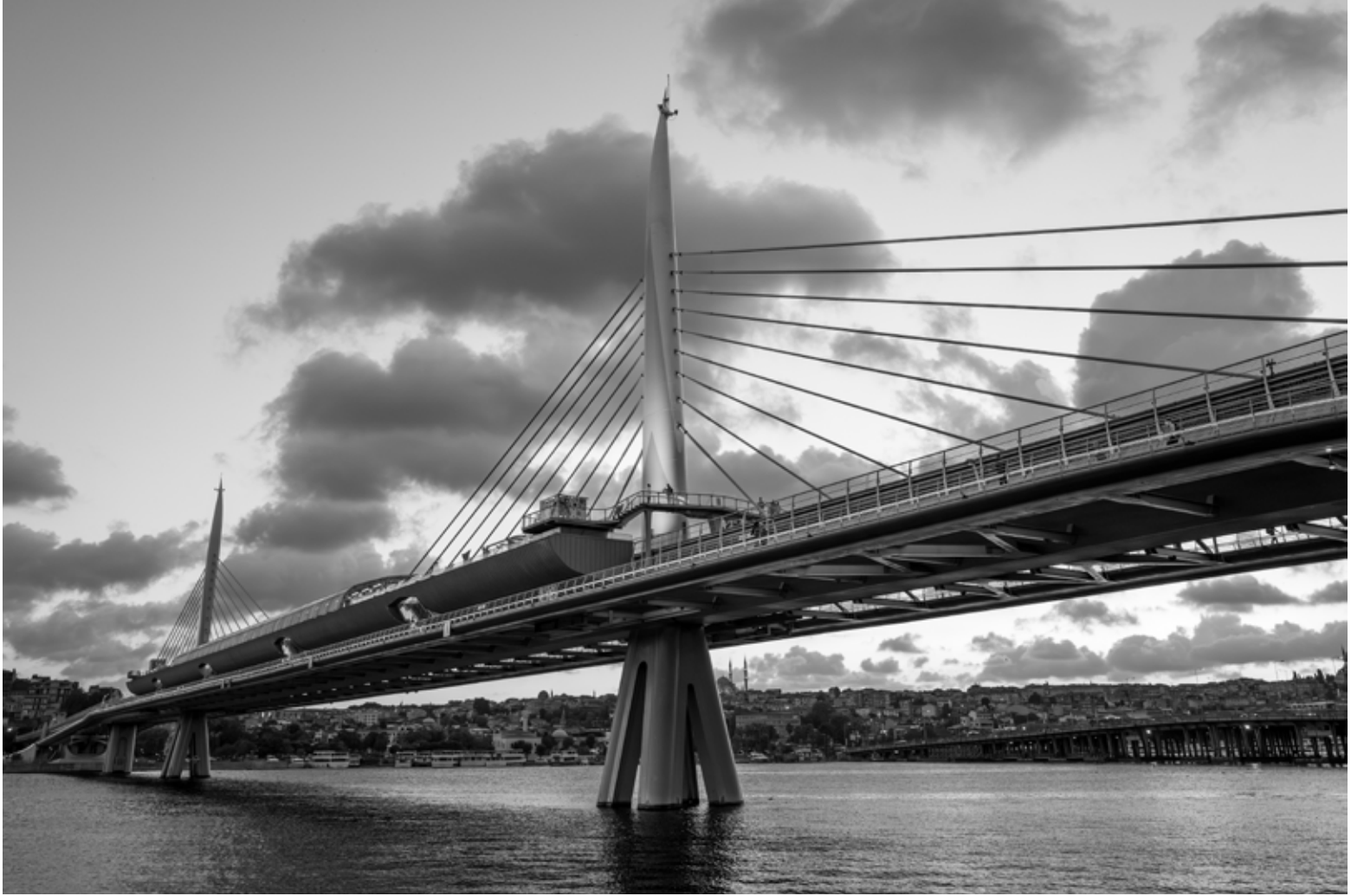
Metro Köprüsü 2, İstanbul / Metro Bridge 2, Istanbul, 2021 Hahnemühle (Photo Rag) asitsiz sanatsal kâğıt üzerine arşivsel pigment baskı Archival pigment print on Hahnemühle (Photo Rag) acid free fine art paper 36,5 x 50 cm [Ed.3+1 AP]