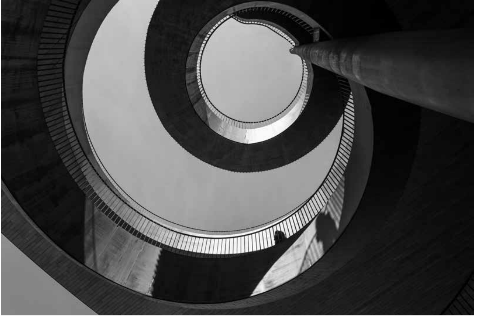
Antinori nel Chianti Classico 2, Toskana / Antinori nel Chianti Classico 2, Tuscany, 2023 Hahnemühle (Photo Rag) asitsiz sanatsal kâğıt üzerine arşivsel pigment baskı Archival pigment print on Hahnemühle (Photo Rag) acid free fine art paper 75 x 105 cm [Ed.3+1 AP]