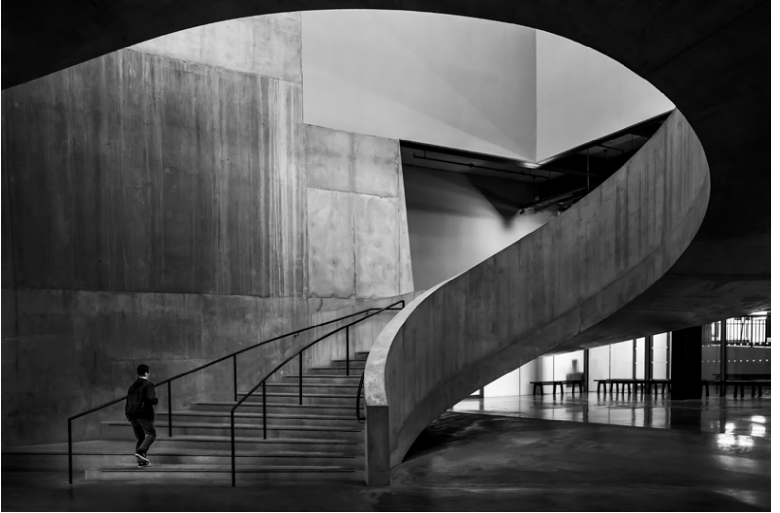
Tate Modern 1, Londra / Tate Modern 1, London, 2022 Hahnemühle (Photo Rag) asitsiz sanatsal kâğıt üzerine arşivsel pigment baskı Archival pigment print on Hahnemühle (Photo Rag) acid free fine art paper 75 x 105 cm [Ed.3+1 AP]