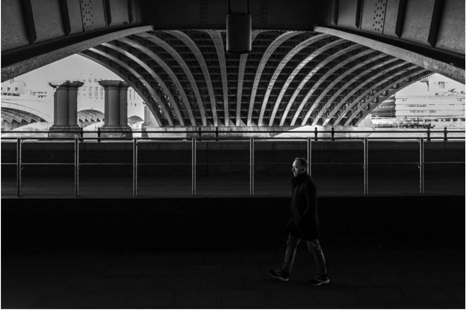
Blackfriars Köprüsü, Londra / Blackfriars Bridge, London, 2023 Hahnemühle (Photo Rag) asitsiz sanatsal kâğıt üzerine arşivsel pigment baskı Archival pigment print on Hahnemühle (Photo Rag) acid free fine art paper 75 x 105 cm [Ed.3+1 AP]